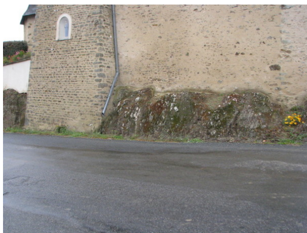
Le repère est au centre de la photo

Liste des repères du triplet : R.F.L3 - 299 , R.F.L3 - 299a , R.F.L3 - 299b , R.F.L3 - 300