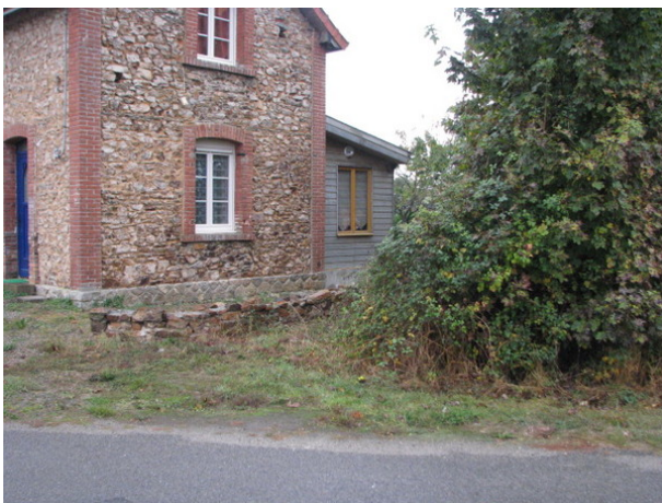
Le repère est au centre de la photo

Liste des repères du triplet : R.F.L3 - 299 , R.F.L3 - 299a , R.F.L3 - 299b , R.F.L3 - 300